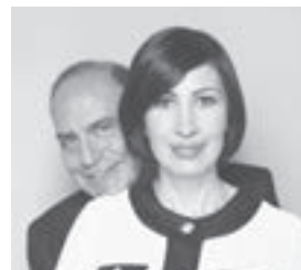
Bruno Vespa e Candida Morvillo

va Compagnia di Canto Popolare. La serata sarà condotta dal giornalista Peppe Iannicelli . Per la Morvillo, originaria di Meta e che ha mosso i primi passi nel mondo del giornali-