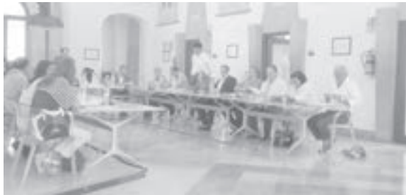
Il Consiglio Comunale

rezza sui conti, sulle partite di debito e su quelle di credito e adottare i provvedimenti consequenziali perché se una società non funziona e registra perdite così consistenti, tralasciando al-