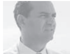
Luigi De Magistris

di Cuma (l'impianto è oggetto di diverse inchieste, tra cui quella sullo sversamento del percolato a mare, ndr). Che rabbia (invece) per quelle foto devastanti. Non siamo di fronte a un inquinamento da area industriale, come per Bagnoli. Il mare di Sorrento poteva essere bevuto, ma è l'ennesima vittima del mal funzionamento dei depuratori che non ci sono o hanno gravi difetti di progettazione, inadeguati alla capienza turistica estiva". Iurillo: cosa possono fare i Sindaci? de