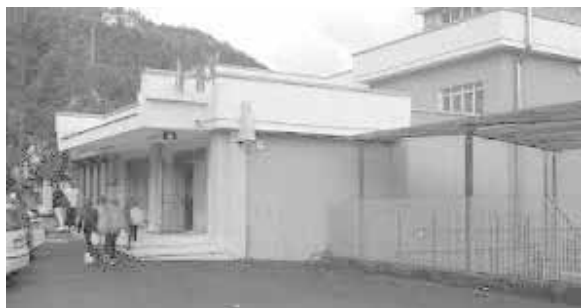
Liceo Scientifico "G. Salvemini"